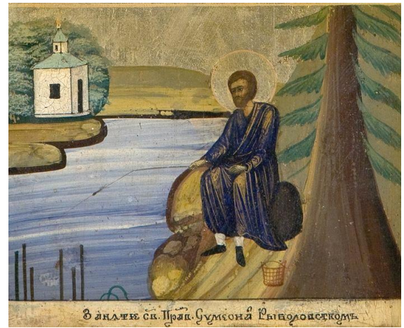
Видение св. Прав. Симеона Верхотурского

Праведный Симеон Верхотурский родился в начале XVII века в европейской части России в семье благочестивых дворян . Повинуясь Божественному водительство, он оставил почести и земное богатство и удалился за Урал. В Сибири праведный Симеон жил как простой странник, скрывая свое происхождение. Чаще всего он посещал село Меркушинское, находившееся недалеко от города Верхотурья, где молился в деревянной церкви.