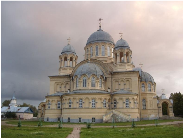
Крестовоздвиженский собор в Верхотурье, где хранятся мощи святого Симеона Верхотурского — третья по объёму церковь в России, уступающая только Храму Христа Спасителя в Москве и Исаакиевскому собору в Петербурге

Праведный Симеон являлся безвозмездным целителем даже таких людей, которые не ведали и не слышали об его прославлении. Так, в 1749 г. один крестьянин, Василий Масленников, был чудесно избавлен праведным от тяжкого и продолжительного недуга. Он жил в Новянском заводе и еще с самого раннего детства был научен некоторыми людьми, уклонившимися от Церкви, изображать на себе крестное знамение двумя перстами. Однажды он сразу впал в тяжелую болезнь; члены его расслабли так, что он не мог владеть правой рукою, не мог говорить. В таком болезненном состоянии он пробыл