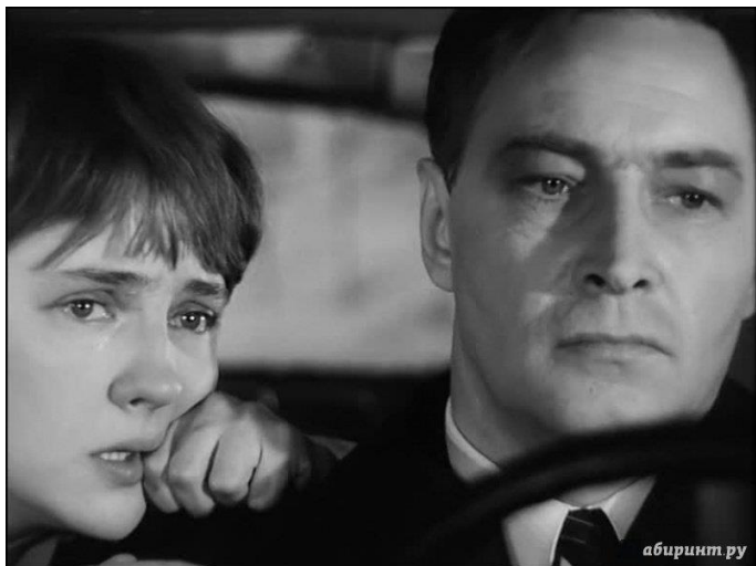
Кадр из фильма «Семнадцать мгновений весны». Радистка Кэт (Екатерина Градова) и Штирлиц (Вячеслав Тихонов).

Актрисе Екатерине ГРАДОВОЙ достаточно было сыграть одну роль – радистки Кэт в легендарном телефильме «Семнадцать мгновений весны», чтобы ее узнали и полюбили миллионы телезрителей.