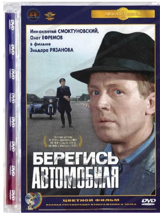
Инноцентий Смоктунувский – в фильме Эльдара Рязанова «Берегись автомобиля».

– Что, с Вашей точки зрения, происходит сегодня со словом? Есть мнение, что в эпоху Интернета слово – как высказывание, за которое нужно нести ответственность, – умирает... – Почему только Интернет? А телевидение, радио, театр, кино? Ведь сейчас принято говорить в любом собрании о чём угодно – невзирая на то, что кто-то может быть убит этим словом, шокирован, развращен, унижен. На нас изливается поток подсознания, порой грязный поток. Люди делятся своими заблуждениями, ересьями, извращениями. Многие