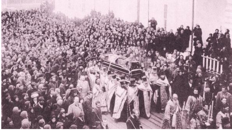
Крестный ход с мощами праведного Симеона. 27 мая 1914 года