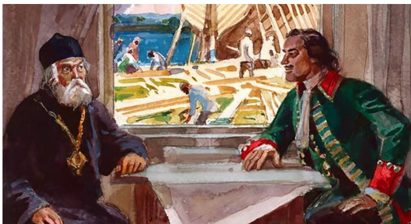
Святитель Митрофан Воронежский с Петром

необходимость и цель которых хорошо понимал. При постройке в Воронеже флота для похода на Азов святитель Митрофан убеждал народ всемерно помогать новому предприятию. Это было особенно важно, ибо многие тогда считали устройство флота на Руси делом бесполезным. Высокий патриотизм святителя соединялся с его непоколебимой верой и строгостью православных убеждений, ради которых он не боялся навлечь на себя