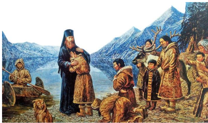
Прощание с Америкой святителя Тихона. худ. Филипп Москвитин

лично от государя Николая-II. Он основал монастырь во имя Тихона Задонского в Пенсильвании, создал множество православных школ и приютов. Американцы, высоко оценив труды русского архипастыря, избрали его почетным гражданином США. Когда святой Тихон покидал Америку, местная паства плакала так же горько, как это было ранее на Холмщине. Впоследствии архиепископ Тихон прилагал труды к трудам на кафедрах в Ярославле и Вильнюсе, проводил службы и молебны на фронтах