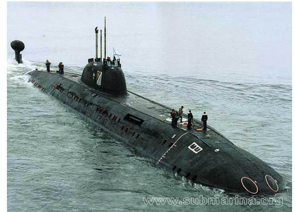
Фото: атомная подводная лодка «Даниил Московский» в губе Ваенга, дата: 2004 год, июль

Из этого совпадения, можно сделать вывод, что Бог - за нас и за нас - святые.