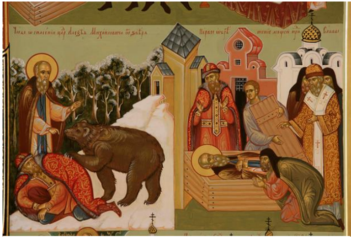
Чудо спасения Царя от зверя. Обретение мощей святого Саввы.

Михайлович (1629-1676) обычно ходил из Москвы в Саввинскую обитель пешком. Такой поход длился три дня и был приурочен ко Дню преставления святого Саввы, которого царь свято почитал после одного случая. Однажды государь охотился в звенигородских лесах. Внезапно в гуще леса на Алексея Михайловича вышел медведь-шатун.