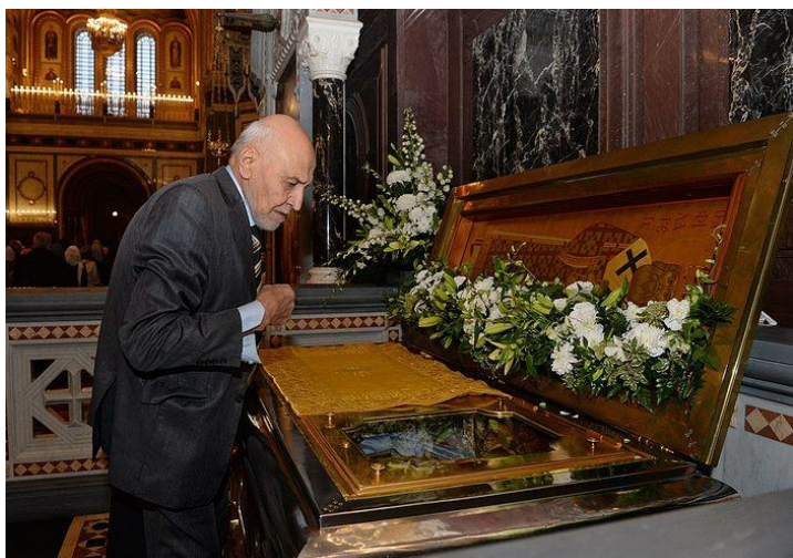
Мощи Святителя Филарета в Храме Христа Спасителя

Перед обедом сел заниматься письменными делами. Через 10 минут пришли напомнить ему об обеде и нашли его коленапреклоненным с опершимися в пол руками. Он уже не мог говорить и вскоре скончался. О его смерти возвестили двенадцать колокольных ударов «Ивана великого». Было ему 84 года. Погребён был святитель в дорогой его сердцу Троице-Сергиевой лавре, в приделе святого Филарета Милостивого, пристроенном по его благословию к Храму Сошествия Святого Духа . В 1994 г. Архиерейским собором Русской православной церкви святитель Филарет был причислен к лику святых, в 2004г. состоялось торжественное перенесение мощей митрополита на место его святительской кафедры – в Москву. Ныне чудотворные мощи Московского святителя Филарета почивают в кафедральном соборе Христа Спасителя