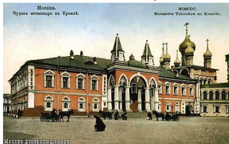
Москва дореволюционная Чудеса митрополита Московского Филарета // Святитель Филарет (Дроздов). Избранные творения. Акафист. М.: Паломникъ, 2003.

Москвичи повторяли ежедневную «авторскую» молитву Филарета: «Гóсподи, не зная, чего мне просить у Тебя. Ты одiн ведаешь, что мне потрѣбно..» Осенью 1867 года Святейший увидел знаменательный сон: к нему пришел его покойный отец и сказал: «Береги девятнадцатое число» . Сослуживший святителю архиерей не придавал этому видению значения, отметив, что снам вообще верить нельзя, на что прозорливый Филарет ответил, что это не сон, а «извещение». С этого времени святитель каждое девятнадцатое число непременно причащался Святых Христовых Таин. Причастился он и 19 сентября, и 19 октября. А 19 ноября (2 декабря по новому стилю) 1867 года митрополит Филарет с особым чувством и слезами отслужил на Троицком подворье в Москве свою последнюю литургию. После неё он принимал в своих покоях нового московского губернатора и беседовал с ним довольно долго.