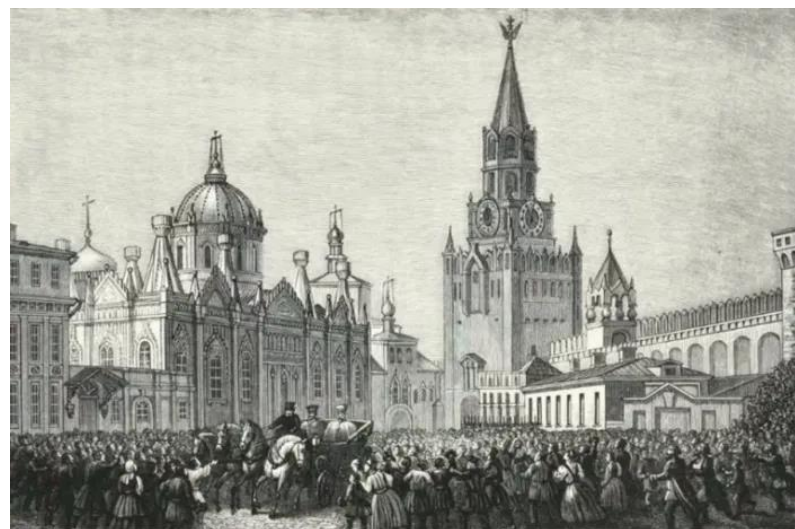
Въезд Царя Николая-I в Москву в 1831г. (гравюра того времени)

Чудотворец. Еще при земной жизни митрополита Филарета болящие и отчаявшиеся искали через его благословение и молитву помощи от Бога, ведь Господь одарил Своего подвижника дарами прозорливости и целительства. Однажды Филарету Московскому была подана на подпись бумага о запрещении служения одному священнику, злоупотреблявшему вином,