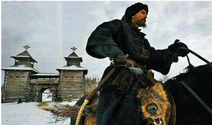
Опричник Царя Грозного. https://kulturologia.ru/blogs/280118/37624

Опричнина. Тем временем с царем Иваном Грозным происходили большие