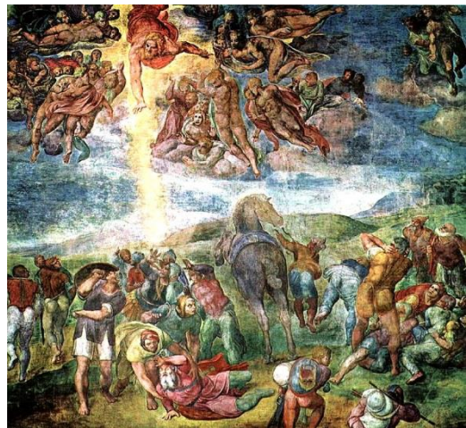
Обращение Савла (фреска), Микеланджело

Савл родился в Малой Азии, в городе, многие жители которого, будучи иудеями, тем не менее, имели права римских граждан (которое давало реальные привилегии, право на особую государственную защиту и рассмотрение любых обвинений в императорском, римском суде. Для еврейского народа с его монотеизмом это было явлением, сравнительно редким. Получил хорошее образование в Иерусалиме и, видимо,