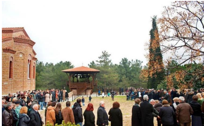
Очередь к могиле Паисия Святогорца

Дьявол терзал святого Паисия еще со времен его усердного послушничества, являясь ему в помыслах, в грохоте, криках и смраде и в чувственном виде. На одной Божественной Литургии блаженный пел и увидел, как из дверей, ведущих в притвор, вываливается страшный зверь. Голова у дьявола была песьей, а из глаз и из пасти выходило пламя. Он качал головой и издевательски пел: «А-а-а!..» , потом погрозил ему лапой и исчез. На Синае враг призывал Паисия, как Христа, броситься на камни и ловил часы, который святой выбрасывал в пропасть от искушения. Однажды, когда старец молился в келье, совершая земные поклоны, лукавый решил его прельстить: «Когда я дошел до слов «Во свете Твоем узрим свет», внезапно за моей спиной разлился сильный свет, как от прожектора, который осветил все вокруг. Я ощутил, что этот свет бесовский, и продолжил читать Славословие. Тогда, увидев, что возмутить меня с помощью «света» не получилось, дьявол придумал другую штуку. Внезапно в нескольких шагах от меня появились два бесенка – вот такусенькие – ростом метра в полтора и начали «бузить», шлепая друг друга в ладоши и пинаясь ногами» Своей молитвой святой Паисий побеждал все дьявольские нападения и козни.